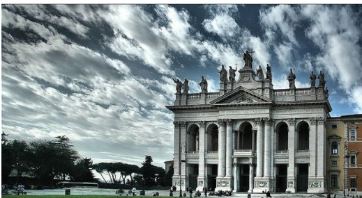
La facciata esterna della Chiesa.

Esso fu eretto su un impianto termale del II sec. d.C., ancora in gran parte percorribile: l'aula battesimale venne situata in modo da poter essere alimentata da questo impianto, ancora funzionante, che si trovava sotto di essa, con forni a legna che scaldavano i mattoni su cui scorreva l'acqua.